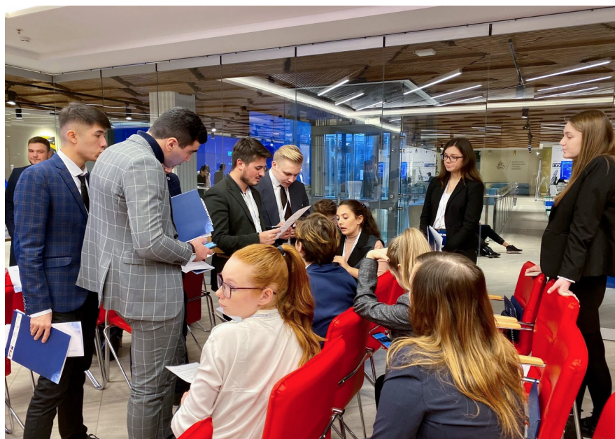
Наверху: сотрудники Кафедры Внизу: подготовка к заседанию Межправительственного совета Международной программы развития коммуникации — Модель ЮНЕСКО