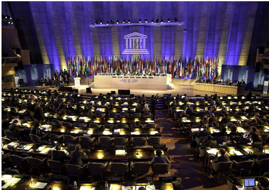
Штаб-квартира ЮНЕСКО, Париж